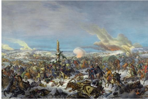
Napoleón cruzando el Berézina (1866) /

Algunas personas todavía “no pueden superar” la derrota de Napoleón ante Rusia, dijo el presidente Vladímir Putin. Hizo estos comentarios después de que el presidente francés, Emmanuel Macron, calificara a Moscú de amenaza para su país. En un discurso televisado el miércoles, Macron dijo que Rusia es una “amenaza para Francia y Europa” y que está considerando ampliar el paraguas nuclear francés para proteger a otros estados miembros de la UE.