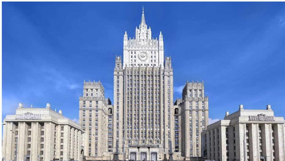
MAE de Rusia /

Presentamos a su atención el último informe del Ministerio de Asuntos Exteriores de la Federación de Rusia sobre los sobre las acciones ilegales del régimen de Kiev contra la Iglesia Ortodoxa Ucraniana , su clero y sus feligreses. Desde hace muchos años, las autoridades de Kiev persiguen activamente en Ucrania la liquidación de la Iglesia Ortodoxa Ucraniana canónica, la discriminación de sus clérigos, la persecución del clero y de los ciudadanos creyentes, obligando al rebaño a trasladarse a la «Iglesia Ortodoxa de Ucrania», cismática creada artificialmente. Para ello se está construyendo el sistema legislativo del país y orientando la actuación de diversas estructuras de poder y seguridad.