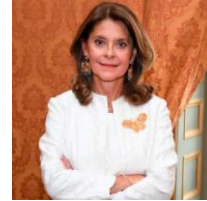
Marta Lucía Ramírez de Rincón Vicepresidente y Ministra de Relaciones Exteriores República de Colombia

Este año 2021 estamos celebrando en Colombia 200 años de actividad del Ministerio de Relaciones Exteriores, así como del ejercicio de la diplomacia para la consolidación de la amistad y desarrollo de relaciones sobre temas estratégicos con otras naciones del mundo, la promoción del país en el exterior y la defensa de los intereses nacionales en todas las esferas de la actividad internacional. El Bicentenario nos invita a valorar la riqueza idiomática y las prácticas diplomáticas, así como las iniciativas colombianas que han fortalecido la construcción fraterna de 200 años de relaciones de Colombia con el mundo.