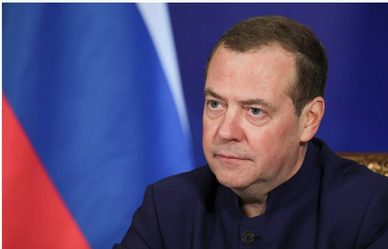
El vicepresidente del Consejo de Seguridad de Rusia, Dmitry Medvedev

TASS // En el contexto de las pérdidas, Occidente reanuda periódicamente "las especulaciones de que es necesario volver a la mesa de negociaciones para encontrar algunos compromisos", agregó el Vicepresidente del Consejo de Seguridad de Rusia.