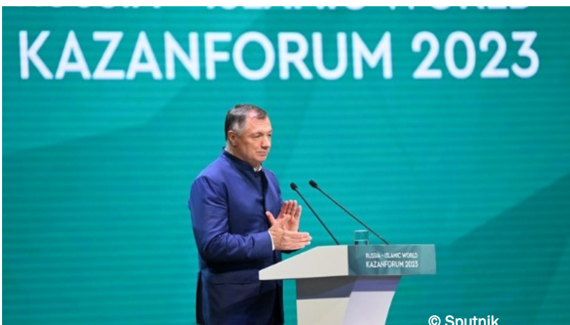
Marat Khusnullin habla en el foro Rusia-Mundo Islámico en Kazán, Tartaristán, Rusia, 19 de mayo de 2023

Swentr.site// Los países islámicos no apoyan las sanciones de Occidente contra Rusia, y los acuerdos firmados en el foro económico de Kazán de esta semana lo demuestran, dijo el sábado a RT el Viceprimer Ministro ruso, Marat Khusnullin.