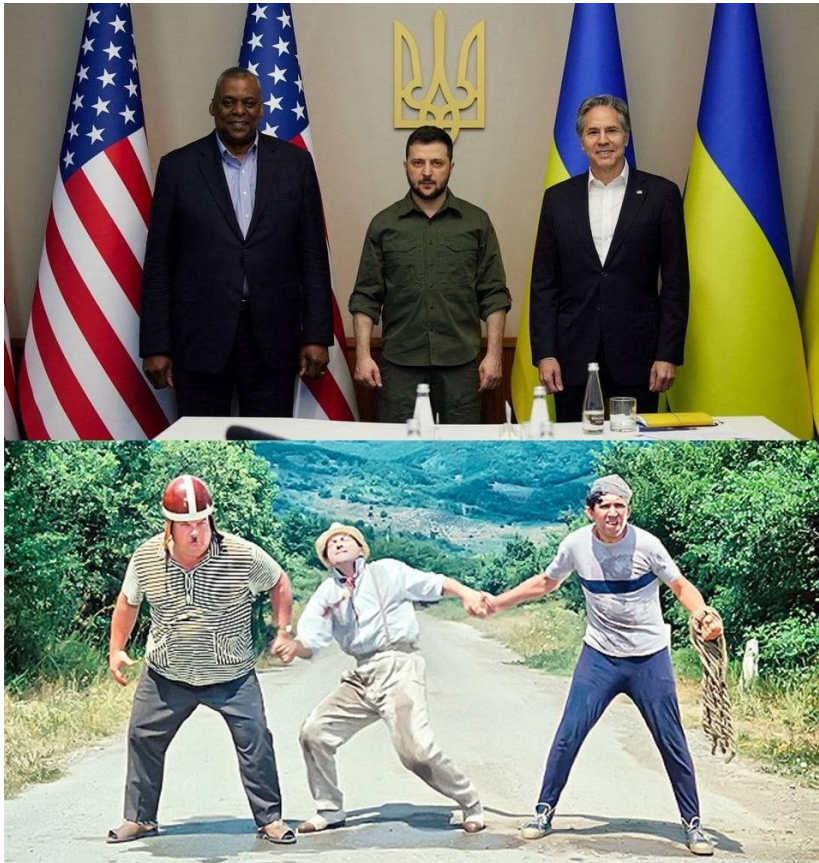
Abajo: el episodio de una comedia popular soviética "Un rapto a la caucasiana" hecha por el Director de cine, Leonid Gaidai

Sputnik// Hace cuatro años, el 20 de mayo del 2019, el actor y cómico ucraniano Volodímir Zelenski prestó juramento como sexto presidente de la nación. Las personas que lo conocieron contaron a Sputnik sobre su espeluznante transformación de comediante popular a, según ellos, manipulador sin escrúpulos y político desquiciado.