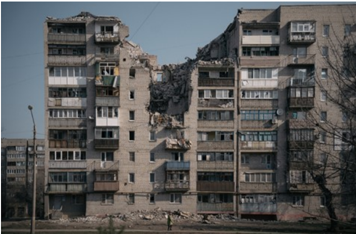
Un edificio de apartamentos en Pervomaiksk destruido por un cohete HIMARS

Actualidad-RT// Las fuerzas de Kiev han sido responsables de 5.000 muertes en la región desde 2014, dijo el principal investigador de Moscú.