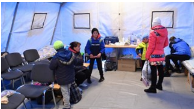
Refugiados de Ucrania en un punto de recepción móvil en el territorio del puesto de control de vehículos múltiples Shebekino en la región de Belgorod en la frontera ruso-ucraniana.

Swentr.site / Desde febrero, Rusia ha aceptado a millones de refugiados de Ucrania y los territorios recientemente incorporados al país, dijo un alto funcionario del Ministerio de Emergencias.