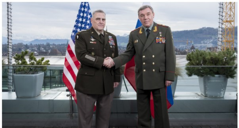
FOTO DE ARCHIVO: El jefe del Estado Mayor General, general Valery Gerasimov, se reúne con el presidente del Estado Mayor Conjunto, general Mark Milley, en Berna, Suiza, el 18 de diciembre de 2019. /Global Look Press/

y agregó que el Reino Unido "rechazó las acusaciones de Rusia de que Ucrania está planeando acciones para intensificar el conflicto". Radakin también "reiteró el apoyo duradero del Reino Unido a Ucrania", agregó la declaración del ministerio. El Ministerio de Defensa ruso afirmó que Kiev quiere enmarcar a Moscú como un "terrorista nuclear" acusándolo de usar armas de destrucción masiva y, por lo tanto, de lanzar una "poderosa campaña contra Rusia". El portavoz del Kremlin, Dmitry Peskov, también afirmó que la incredulidad de Occidente en este escenario no hace que la amenaza sea menos apremiante. LEER MÁS