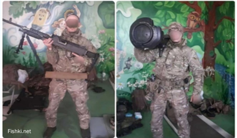
Combatientes de las fuerzas armadas de Ucrania con los estadounidenses ametralladora M240V y británica NLAW ocupan la defensa en la guardería infantil.

Si bien reconoce las irregularidades de Ucrania, el informe, sin embargo, afirma inequívocamente que "las fuerzas armadas rusas son responsables de la gran mayoría de las violaciones identificadas". Si bien los casos de maltrato de prisioneros de guerra rusos a manos de combatientes ucranianos están respaldados por pruebas sólidas, como videos, las supuestas violaciones cometidas por las fuerzas rusas se basan principalmente en relatos de testigos. LEER MÁS