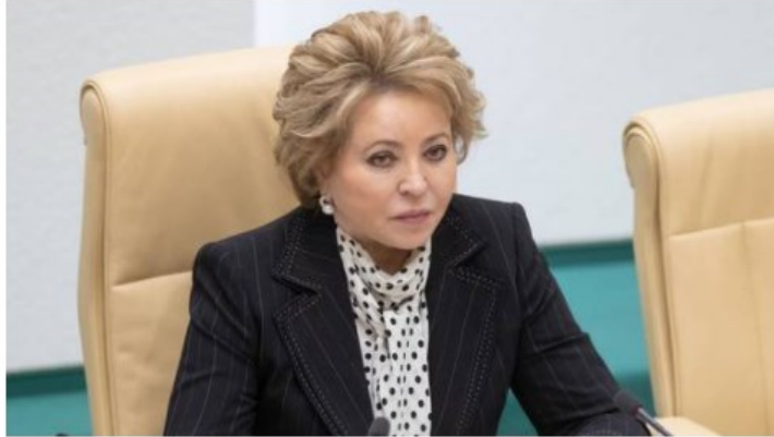
La jefa del Consejo de la Federación Rusa Valentina Matvienko

La Presidenta del Consejo de la Federación de Rusia, Valentina Matvienko, ha pedido al parlamento ucraniano que inicie de inmediato conversaciones de paz con miras a resolver el conflicto entre los dos países.