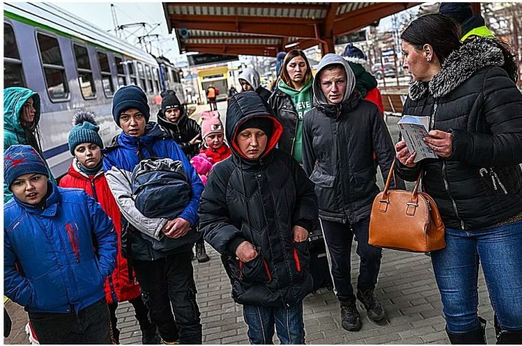
Menores ucranianos a punto de embarcar en un tren rumbo a Wroclaw (Polonia).

El flujo desordenado de refugiados desde Ucrania crea condiciones favorables para los traficantes de personas, escribe El Mundo. El problema es que en algunos países de la UE no hay un control estricto de las fronteras, ni registros de inmigrantes, ni control de quiénes llegan desde Ucrania, explica el artículo.