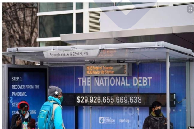
Personas con mascarillas esperan en una parada de autobús, donde se ve un cartel que muestra de la deuda nacional actual en medio de la pandemia de COVID-19 en Washington, el 31 de enero de 2022.

Deuda nacional de EE. UU. supera los 30 billones de dólares por primera vez en la historia