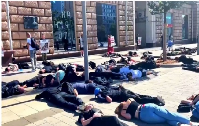
Manifestantes que se hacen pasar por víctimas protestan contra el uso de minas antipersonal por parte de Kiev contra civiles. Telegram. @readovkanoticias

Un grupo de manifestantes se reunió en las embajadas de Estados Unidos y Francia en Moscú para protestar por el uso de minas dispersables por parte de Ucrania, respaldada por la OTAN. Los manifestantes pegaron imágenes de las minas en la acera alrededor de las embajadas. Las pegatinas presentaban un código QR que dirigía a un sitio web que explicaba qué son las minas PFM-1 y acusaba a Ucrania de arrojarlas en las ciudades.