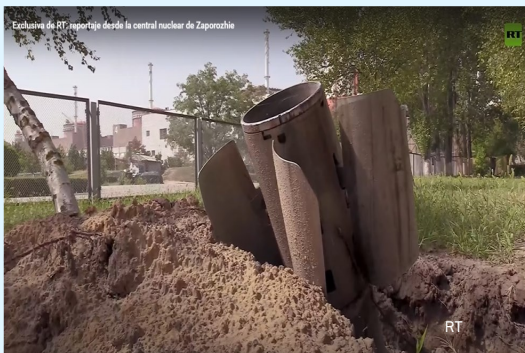
Exclusiva de RT: reportaje desde la central nuclear de Zaporozhie

En un recorrido a pie por los predios de la central nuclear más grande de Europa, no pasan desapercibidas las innumerables huellas de proyectiles de artillería en las paredes, los socavones en el suelo y otros rastros de destrucción dejados por los ataques de Kiev, que se producen casi a diario. Las fuerzas armadas rusas llevan registros de todos esos bombardeos.