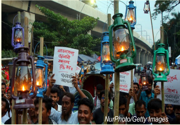
En Dhaka, la capital de Bangladesh, la gente se manifiesta contra la falta de electricidad.

En su intento de liberarse de su dependencia de Rusia a una velocidad récord, la UE está provocando turbulencias masivas en los mercados mundiales de la energía, que afectan especialmente a los países pobres, comenta el reconocido columnista Matthias Peer en un artículo