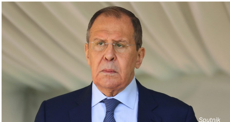
El ministro de Asuntos Exteriores de Rusia, Serguéi Lavrov

El canciller ruso subrayó que no ve ninguna razón para "crear tal irritación prácticamente de la nada, sabiendo muy bien lo que significa para la República Popular de China".