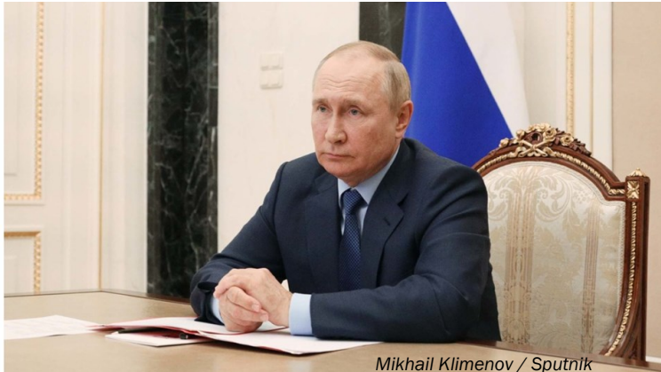
Mikhail Klimentov / Sputnik