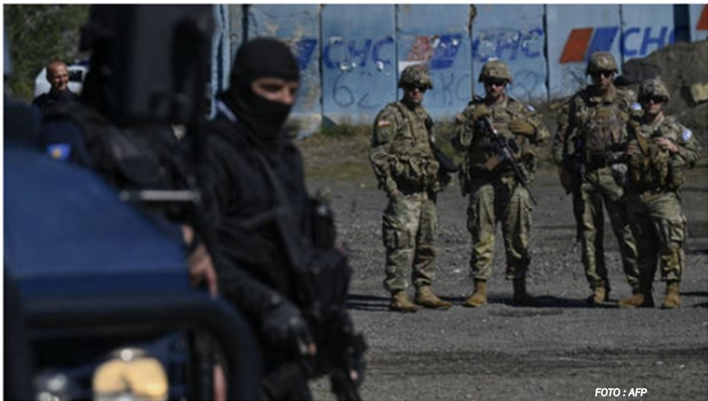
Soldados de la OTAN patrullan junto a la policía de Kosovo, cerca de la frontera entre Kosovo y Serbia, el 2 de octubre de 2021

En ambos casos, Occidente no presionó al lado que apoya para que se adhiriera a los acuerdos internacionales firmados.