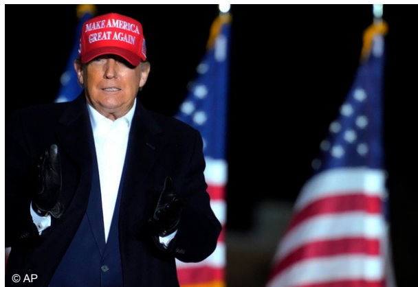
LEER MÁS >> https://thehill.com/homenews/administration/600297-trump-urges-putin-to-release-dirt-on-hunter-biden/

El ex presidente en esa entrevista, señala la publicación,